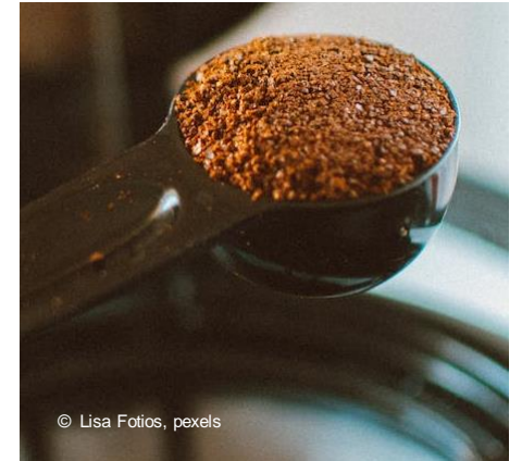
Bohnen werden gemahlen