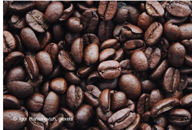
Bohnen werden geröstet