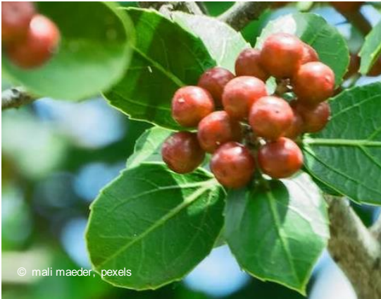
Kaffeekirsche wird geerntet